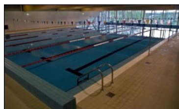
25 metriä pitkä uima-allas vesipuiston lisäksi

Aamiainen hotellissa. Lähtö bussilla kylpylästä klo 12.00 kohti Tallinnaa. Viking Linen XPRS alus lähtee A-terminaalista klo 17.00 (Tallinnassa omaa aikaa noin 2,5 tuntia) ja alus on Helsingissä klo 19.30, josta välittömästi bussimatka Lahteen. Paluu Lahdessa n. klo 21.30.